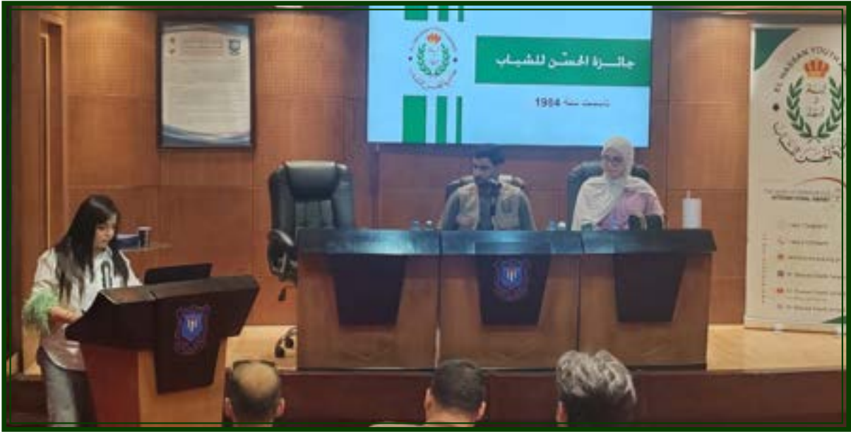
جامعة عمان الأهلية يوم الخميس الموافق ٢٠٢٦/٥/١٤

تم تنفيذ ٣ زيارات إلى عدد من الجامعات بهدف التعريف بالجائزة وبرامجها المختلفة وآلية التسجيل عبر السجل المحوسب، إضافة إلى التعريف ببرنامج "سابلة الحسن" المخصص لطلبة الجامعات، والذي يهدف إلى تنمية المهارات القيادية والشخصية وتعزيز روح المبادرة والعمل التطوعي وخدمة المجتمع.