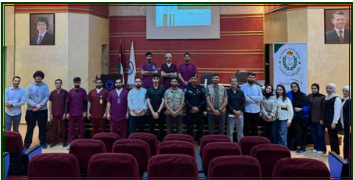
جامعة فيلادلفيا يوم الثلاثاء الموافق ٢٠٢٦/٥/١٢